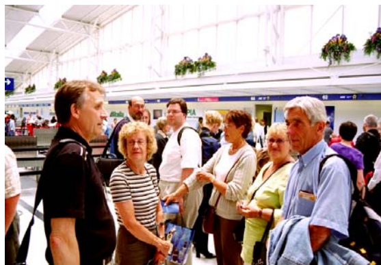
Resesällskapet samlat på O’Hare, Chicago

När jag står först i kön till incheckningen, hoppas jag naturligtvis kunna tjäna litet pengar till nästa biljett genom att bli erbjuden att åka med ett annat flygbolag. Men denna gång har man bara sex platsers överbokning och tror sig kunna klara det hela utan att skicka några passagerare med Al Italia eller Lufthansa. Därför hamnar några av oss till slut i Economy