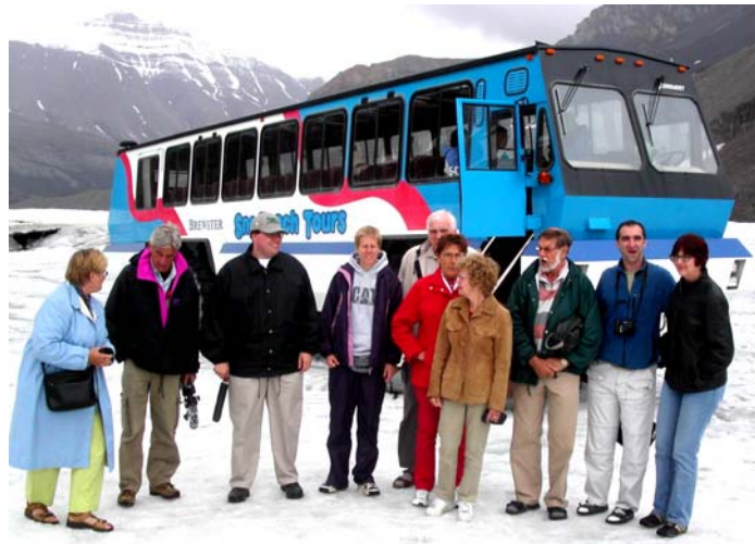
Delar av resesällskapet stående på den ca 300 tjocka isglaciären

utfärder på de känsliga glaciärerna. Det är bara det att hon ger oss en uppsjö av oväsentliga detaljer, som snabbt rinner av oss, snabbare än glaciären någonsin har smält.