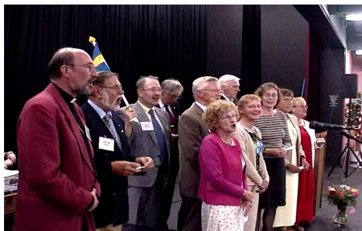
En improviserad svenskbykör tar ton