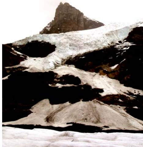
Rocky Mountain, Jaspers nationalpark

mognat. Men bergens hättor skiftar i gult eller ockra. Molnen hänger som dåligt spända tak över oss. Det är som om de smeker bergens nakna hy med sockervaddssömhet.