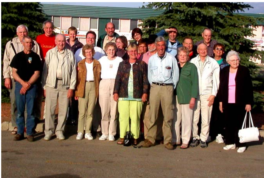
Vi som besökte jubileet i Wetaskiwin juni 2005

Efteråt äter vi en lätt lunch i turistshopen, innan det är dags för den långa hemfärden, då de redan undfådda intrycken tydligt dämpar sinnenas mottaglighet för nya. Någon gång vaknar man till, särskilt då vi passerar en ranch med bisonoxar.