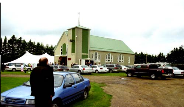
Calvary Lutheran Church i Wetaskiwin