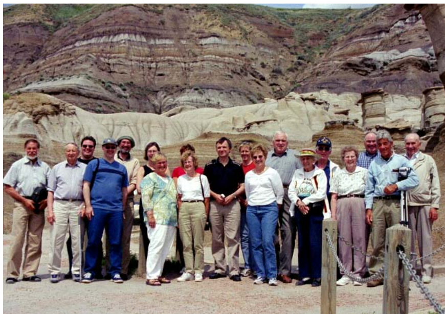
Hela resesällskapet på utflykt till Drumheller

Området runt dem är minst lika säreget med grottor och fåror som löper längs sluttingarna. Vi låter fotografera oss tillsammans med dessa urtidsfigurer och bilden kommer förmodligen att inom en snar framtid leta sig fram till någon svensk drake, möjligen av mindre format.