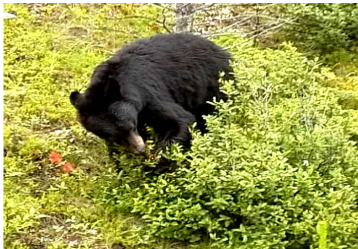
Kanadensisk Svartbjörn som uppenbarade sig vid vägkanten

Efter utfärden sitter vi på nytt i vår vanliga buss. Fortfarande strilar regnet ner och ger, trots allt, omgivningen en ganska hygglig uppsyn. Vi åker nu neråt längs den undersköna dalen, där floden slingrar sig i gröna vindlingar genom terrängen. Jag sitter ett tag som paralyserad och stirrar ut genom fönstret och tanken irrar bland möjligt uppdykande björnar.