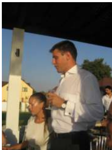
En stolt far håller tal