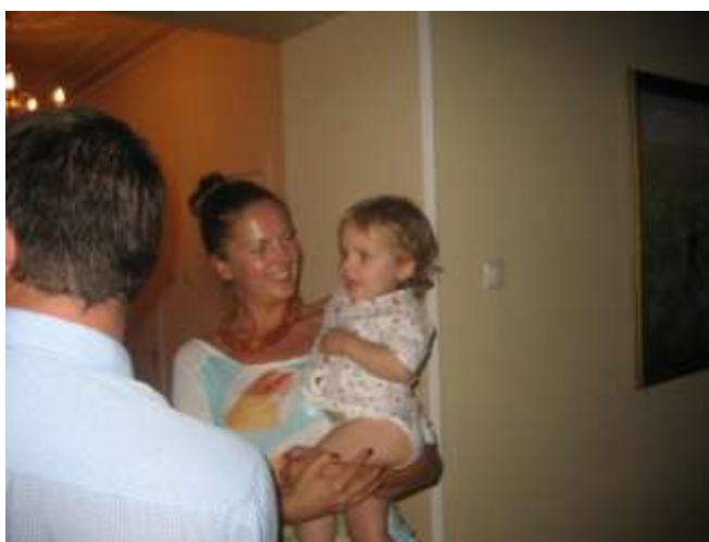
Mark på måndagsmorgonen

Så är det dags att ta avsked av familjen.