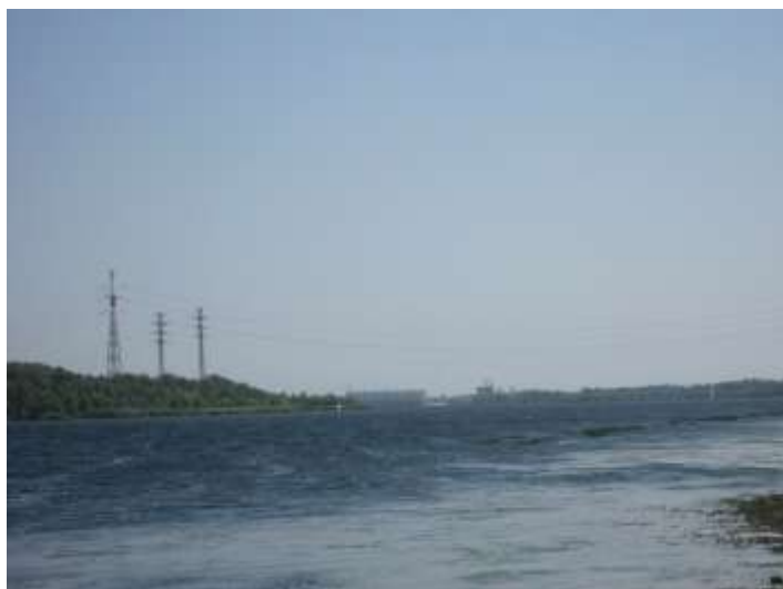
Utsikt mot vattenkraftverket

även om vinden bara är ljum och i jämförelse med resten av luften nästan känns kall. Härifrån har man en vacker utsikt uppströms Dnjepr mot vattenkraftverket i Kachovka. Floden är här betydligt renare än i vattenreservoaren, eftersom föroreningar sjunker till botten där, medan det klarare vattnet hittar vägen förbi turbinerna.