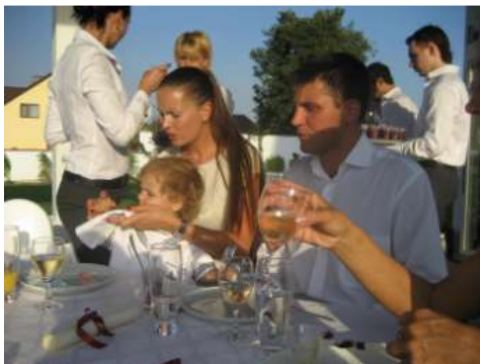
En fläck på dopbarnets skjorta torkas bort

Så här ser den inbjudande menyn ut. Huvudrätten är nötkött med grönsaker i provensalsk stil.