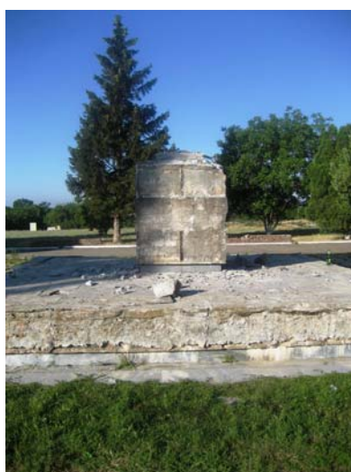
Lenin är för alltid borta

Jag går upp tidigt på morgonen för att få en sista glimt av Lenin. Men när jag kommer fram till kulturhuset finns där bara en naken sockel. Hans saga i byn är all.