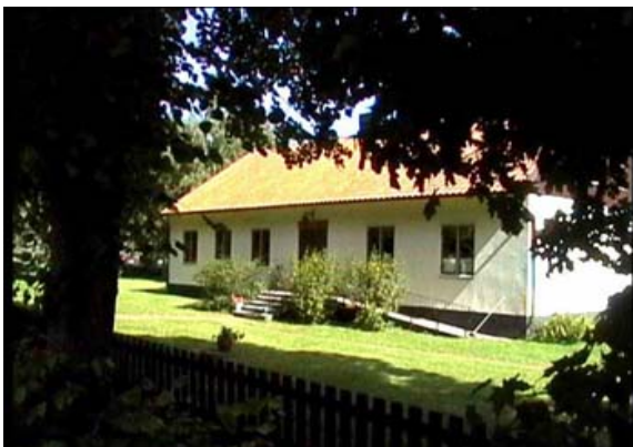
Svenskbygården i Roma

Föreningen har sina styrelsemöten i Svenskbygården. I svenskbygården finns f.ö. ett museum .