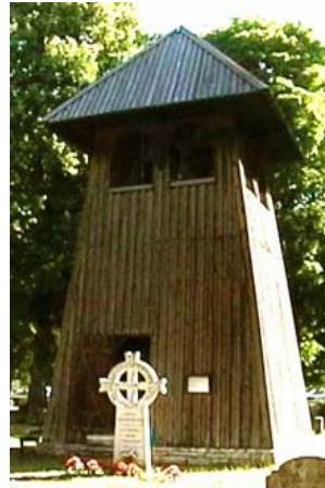
Klockstapeln vid Roma kyrka med Kristoffer Hoas grav i förgrunden