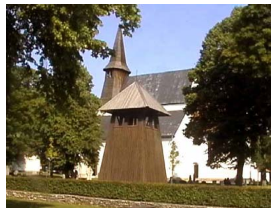
Roma kyrka på Gotland med klockstapeln i förgrunden

Föreningen har sina styrelsemöten i Svenskbygården. I svenskbygården finns f.ö. ett museum .